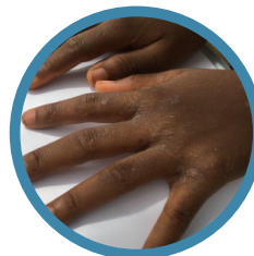
疥癬など 外部寄生虫症