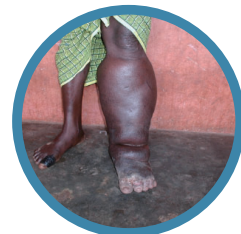
リンパ系 フィラリア症