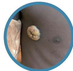
フランベジア (イチゴ腫)