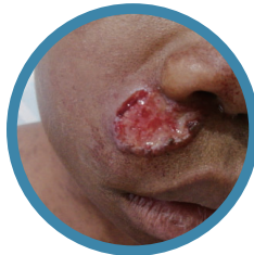
皮膚 リーシュマニア症