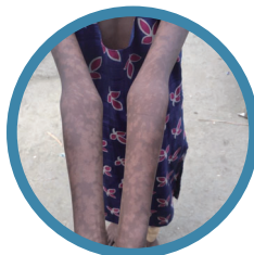
カラ・アザール後 皮膚リーシュマニア症