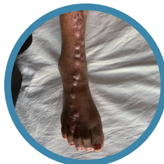
スポロトリコーシス